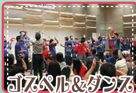
ゴスペル&ダンス パフォーマンス