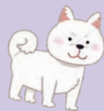
左から、チョコ・こむぎ・コロン